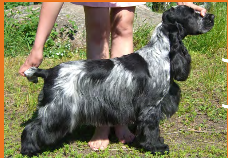
Näyttely linjainen: .A One's Teodora, kuva: Eva Bensky

Myös näyttelylinjaisesta cockerspanielista on täysin mahdollista saada toimiva metsästyskoira. Metsästystoimikunta voi antaa vinkkejä pennun hankintaan.