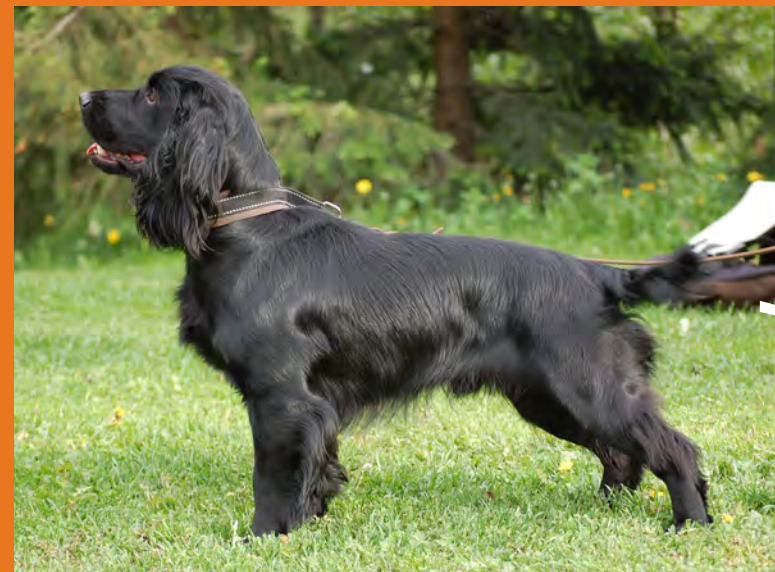
Käyttölinjainen: Witch-Hunt's Eddie Vedder kuva Ulla Ruistola