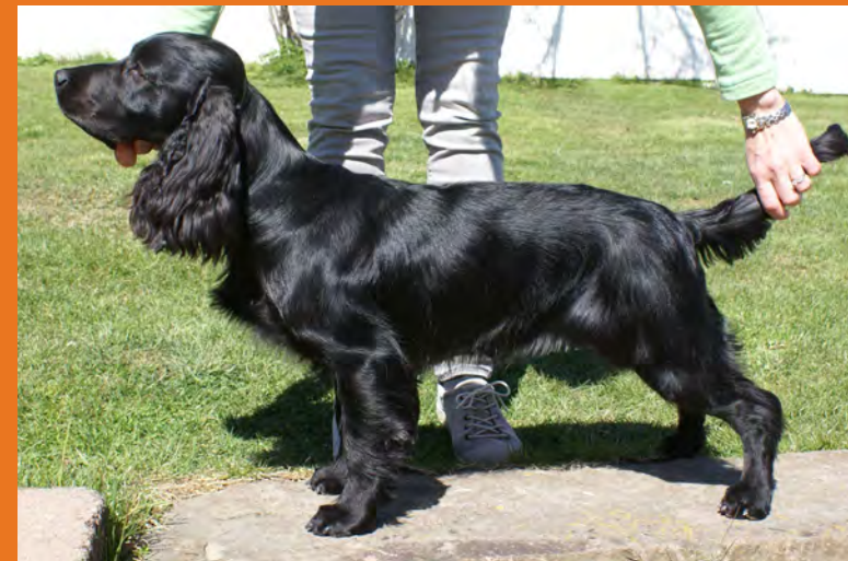
Sekalinjainen: Eben's My Girl the Superstar